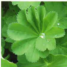
Frauenmantel (Alchemilla vulgaris L.)

Unsere Beratungsangebote sind unabhängig und anonym.